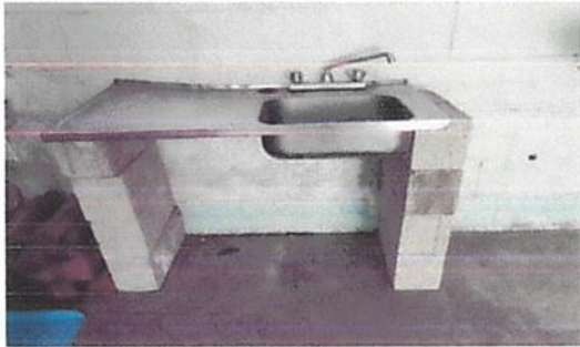
foto 1. mejoramiento de lavatrastos que se encuentra en la cocina, para lavar trastos y las verduras al momento de la preparación de la refacción escolar.