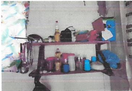
foto 3. Sustitucion del lugar donde colocan y guardan los alimentos, por un gabinete o estanteria, elaborado de cemento , de un tamaño adecuado a las necesidades del centro educativo.