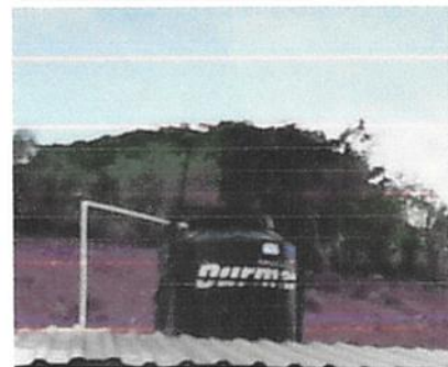
foto 6. Sustitucion del tinaco, por uno de tamaño adecuado, asi como la proteccion o modo de dejarlo seguro, debido a que ya se robaron el que estaba anterior al existente en la escual.

Observación: Si es necesario se pueden agregar hojas adicionales y actualizar el número de hojas.