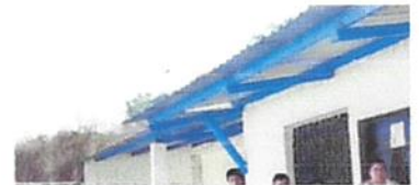
foto 4. sustitucion de canales y láminas del techo existen.