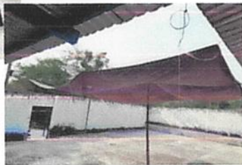
foto 5: Mejoramiento del techo del patio de recreo por uno de lámina, ya que al momento solo está cubierto por lona, para evitar que se quemen demasiado del sol los niños.