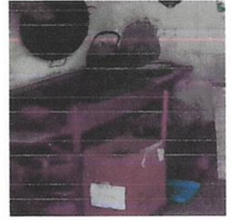
foto 2. sustitucion de la plancha lorena existente, porque esta dañada y sustitucion de las mesas de madera por una de cementos de medidas y tamaño adecuado.